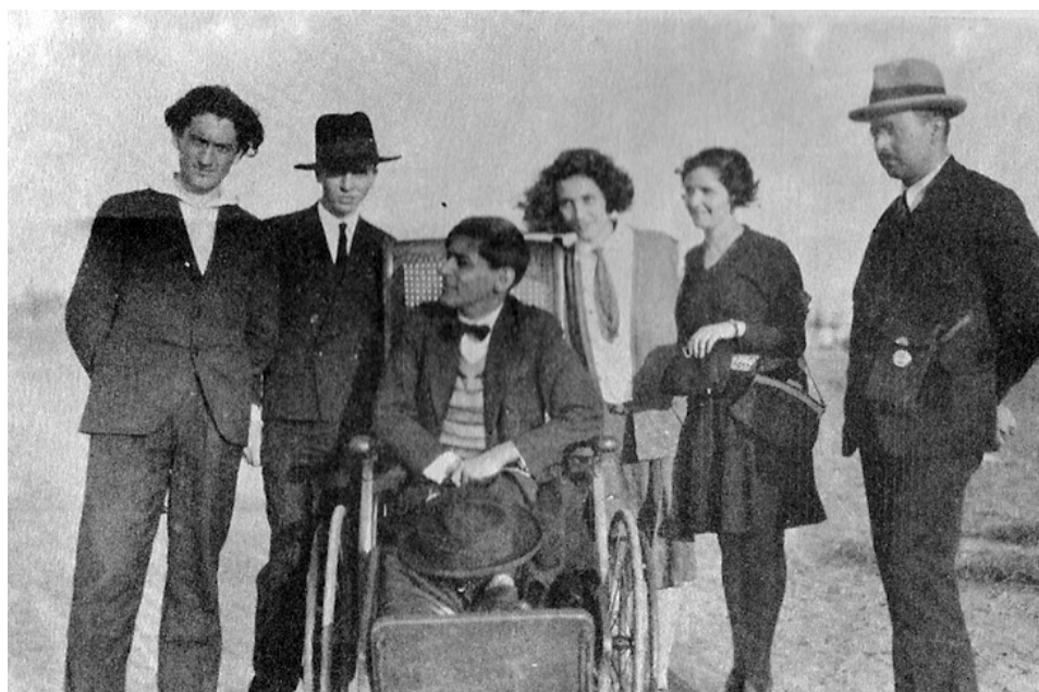
Fig. 2. José Carlos Mariátegui en Europa

Este sectarismo contrasta con una época previa, las décadas de 1920 y 1930, en que Mariátegui e izquierdistas europeos buscaban, por separado, una psicología integral que fuera compatible con el marxismo, al que no concibieron como una doctrina cerrada o concluida. Tales esfuerzos dieron origen, por citar un caso, a la Escuela de Frankfurt y sus aportes.