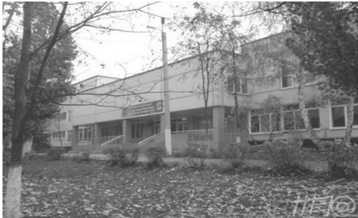
Fig. 7. Escuela n.º 17 de Járkov 9

A diferencia del grupo moscovita, cuyo foco principal fue el desarrollo del pensamiento teórico, el grupo de Járkov se interesó inicialmente por el papel de la memoria en el aprendizaje colectivo, en el marco de la teoría de la actividad. Este interés condujo progresivamente a la elaboración de un modelo educativo propio, posteriormente reconocido como aprendizaje colectivo desarrollador. Las Escuelas n.º 04 y n.º 17 de Járkov se consolidaron como instituciones experimentales de referencia, junto con la Escuela n.º 91 de Moscú.