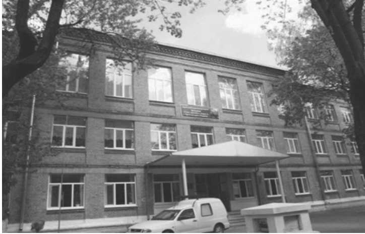
Fig. 7. Escuela n.º 04 de Járkov 8

A diferencia del grupo moscovita, cuyo foco principal fue el desarrollo del pensamiento teórico, el grupo de Járkov se interesó inicialmente por el papel de la memoria en el aprendizaje colectivo, en el marco de la teoría de la actividad. Este interés condujo progresivamente a la elaboración de un modelo educativo propio, posteriormente reconocido como aprendizaje colectivo desarrollador. Las Escuelas n.º 04 y n.º 17 de Járkov se consolidaron como instituciones experimentales de referencia, junto con la Escuela n.º 91 de Moscú.