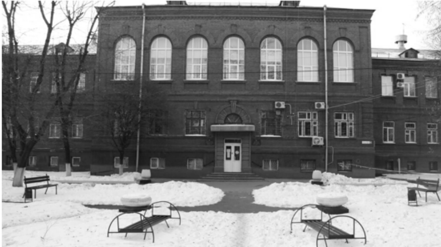
Fig. 2. Academia Psiconeurológica de Ucrania, Járkov 1