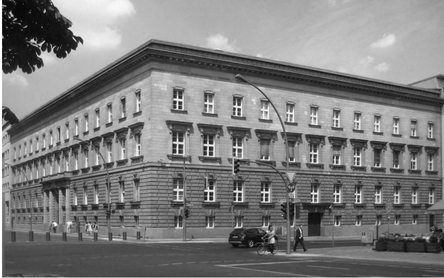
Fig. 10. Academia de Ciencias Pedagógicas de la RDA

La Alemania Oriental, al igual que otros países, atravesaba un momento caracterizado por el formalismo, con una escuela tradicional basada en la teoría reflejo-asociativa, que priorizaba la reproducción. No obstante, a