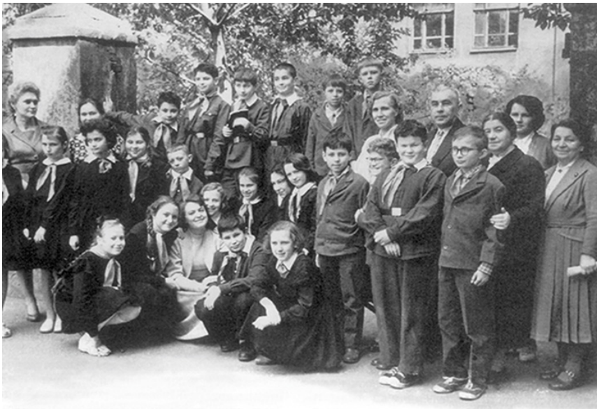
Fig. 4. L. V. Zankov y su equipo de laboratorio con alumnos de la clase experimental de la Escuela 172ª de Moscú. A la izquierda de L. V. Zankov, M. V. Zvereva, a la derecha - Z. I. Romanovskaya.

La primera iniciativa experimental en centros educativos tuvo lugar en Moscú, en la Escuela n.º 172, en 1957. Bajo la coordinación de Leonid Vladimirovich Zankov (1901-1977), antiguo alumno de L. S. Vigotski, y con la colaboración del profesor N. V. Kuznetsova, el trabajo comienza con una sola clase de alumnos, pero experimenta una importante expansión, llegando a varias escuelas de más de 50 territorios, regiones y repúblicas autónomas de la República Socialista Federativa Soviética de Rusia (RSFSR). El resultado de veinte años de actividades experimentales dirigidas por L. V. Zankov conduce a la estructuración del sistema psicológico-didáctico del mismo nombre 4 , cuyo enfoque se basa esencialmente en la psicología histórico-cultural, orientada por L. S. Vigotski.