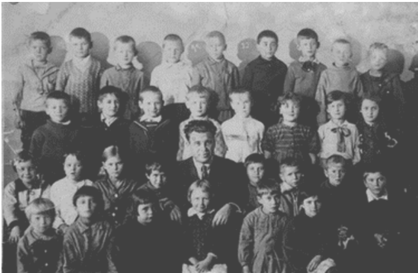
Fig. 5. D. B. Elkonin y sus alumnos de 1º año

La actividad experimental del grupo inaugura una sucesión de otras, con un espíritu pionero que lo situó como un importante centro donde nació y se desarrolló el sistema. El primer trabajo experimental en clases de alumnos dentro de este sistema fue realizado en la ciudad de Moscú por D. B. Elkonin