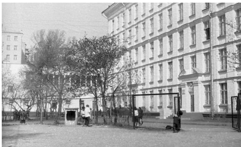
Fig. 6. Escuela n.º 91 de Moscú

En 1959 se inició el proyecto experimental en la Escuela n.º 91 de Moscú, que se convirtió en el principal laboratorio del sistema. Las primeras experiencias se desarrollaron en clases de primer año, con D. B. Elkonin a cargo del currículo de lectura y V. V. Davidov del área de aritmética. Estos estudios se apoyaron en investigaciones previas de L. V. Zankov y, especialmente, en el procedimiento de formación gradual de acciones mentales de P. Ya. Galperin (Elkonin, 2019), utilizado inicialmente como recurso metodológico para organizar el aprendizaje colectivo.